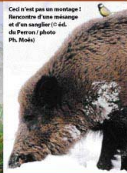
Ceci n'est pas un montage ! Rencontre d'une mésange et d'un sanglier